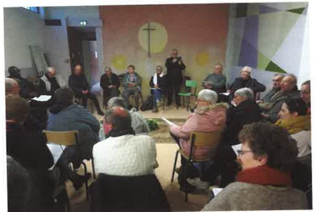
Rencontre diocésaine des membres du Prado en décembre 2025.

« J'ai été beaucoup marqué par un prêtre pradosien de ma paroisse : pour lui, l'Évangile et la présence aux plus pauvres étaient intimement liés. J'ai aussi grandi dans ma foi grâce à la JOC, puis à l'ACO et le militantisme syndical. Quand j'ai été interpellé pour